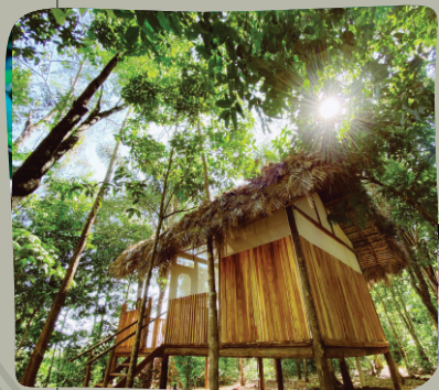
CABANA HETÔ RIO